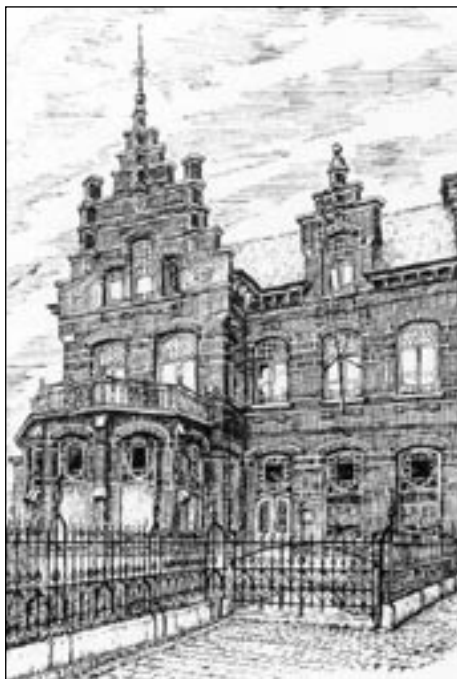
Huis Lambrechts, Maricolenweg, nu warenhuis

droegen een groot koperen ornament op de mooiste plaats in de pronkgevel, zoals villa Bessems en villa Lambrechts (12) . Bescheidener was de ornamentuur van de villa De Vos-Bosteels in de Bovendonkstraat. De nieuwe pastorie van Opstal kreeg twee ornamenten, één op elke hoek van het dak, en nog eens twee, één op elke dakkapel (13) . Café Den Yzer, het huidige Chinees restaurant, kreeg een centrale bol (14) .